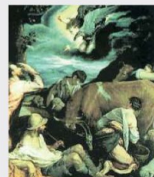
Il quadro di Jacopo Da Ponte

A Cinemazero, infine, per "Gli occhi sull'Africa", alle 20.45, documentario in anteprima nazionale "Soldi libertà". —