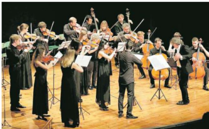
L'Accademia d'archi Arrigoni sarà protagonista del concerto del 24 novembre a Pordenone