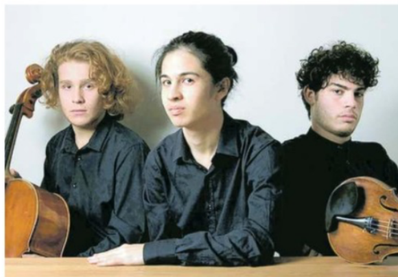
Il Trio Chagall. Saranno in concerto a Palazzo Lantieri a cura del Premio Trio di Trieste

Quattro appuntamenti tra Gorizia e Pordenone organizzati dai maggiori Concorsi internazionali