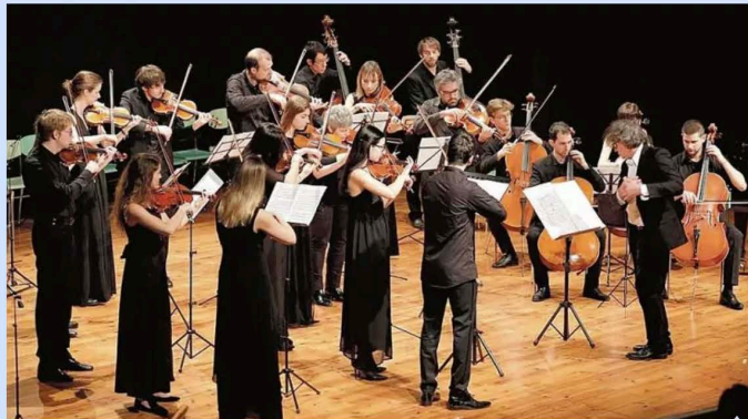
L'Accademia d'archi Arrigoni sarà protagonista del concerto del 24 novembre a Pordenone

11 Novembre 2023 alle 07:00 | 2 minuti di lettura